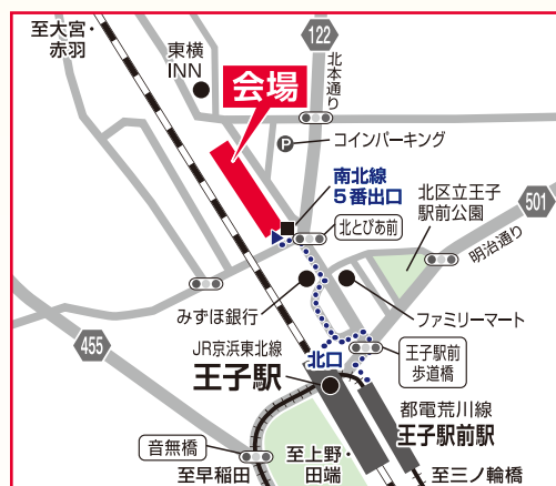
ご来館の際は、できるだけ公共の交通機関をご利用ください。